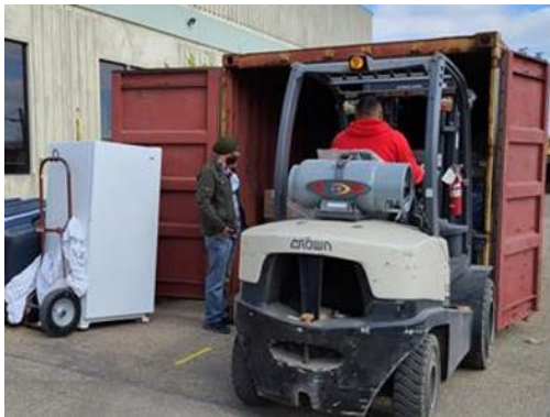
Espace d'entreposage offert au projet Au nord du 60 e par Amnor Group.

La logistique et le transport sont les principaux éléments du projet et, sans le soutien des entreprises suivantes, ce dernier ne pourrait pas continuer d'exister. Amnor Group, à Edmonton, fournit gratuitement un espace d'entreposage à l'équipe du projet depuis plusieurs années. Ils aident également au chargement des palettes par chariot élévateur dans les conteneurs maritimes.