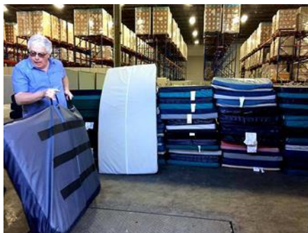
Matelas de sol fournis par les Services de santé de l'Alberta.

Les machines à coudre et les tissus sont maintenant devenus des articles standards de nos envois dans l'Arctique. Nous récupérons des machines à coudre usagées auprès de nombreux donateurs privés ainsi que chez Johnson Sewing et Central Sewing, deux grands magasins de détail d'Edmonton. Ces machines sont ensuite remises à neuf par des techniciens afin qu'elles soient prêtes à l'emploi.