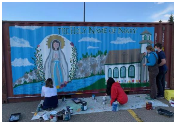
Des jeunes de la paroisse St. Thomas More peignent le conteneur maritime.

Les communautés de Tsiigehtchic et de Fort McPherson ( voir la vidéo ) sont situées au sud d'Inuvik, de part et d'autre de la rivière Peel. Le conteneur maritime a été peint et préparé en vue d'être placé en permanence à côté de l'église de Tsiigehtchic. À l'avenir, il sera utilisé pour l'entreposage et la distribution des marchandises expédiées dans le cadre du projet Au nord du 60e .