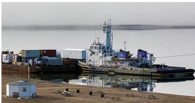
Débarquement de la barge à Sachs Harbour

Sachs Harbour , qui compte une centaine d'habitants, est la plus petite communauté rejointe par le