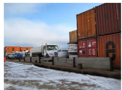
Manitoulin Transport et Services de transport maritime du GTNO