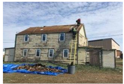
La Maison du Père (1935), à Paulatuk, laissée à l'abandon depuis 20 ans, est actuellement restaurée en vue de son utilisation future comme centre de distribution de nourriture et de vêtements.

Le lancement du projet Au nord du 60 e de la SSVP dans cette deuxième communauté a permis de mettre en place une nouvelle stratégie. La paroisse catholique Our Lady of Perpetual Help de Sherwood Park a été jumelée à Paulatuk. En plus de l'envoi de nourriture et d'articles ménagers dans des conteneurs maritimes, les Vincentiens ont fourni des matériaux de construction (revêtement, toiture, etc.), des fenêtres, une chaudière et des équipements fournisseurs d'énergie pour restaurer la Maison du Père ( Father's House ). La généreuse contribution financière d'une fondation familiale a permis la restauration de ce bâtiment pour en faire un centre de distribution de la SSVP pour le hameau. Le plan pour l'année prochaine est d'envoyer un ouvrier bénévole sur place pendant un mois afin de rattraper le retard accumulé en raison des restrictions liées aux déplacements des deux dernières années.