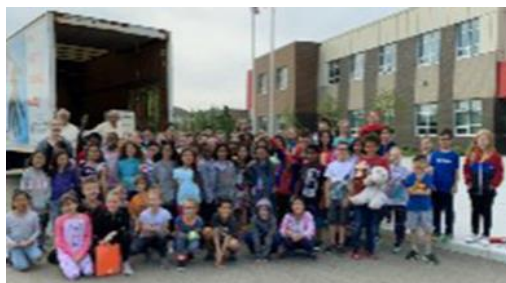
Des étudiants participant à une collecte

vie et celle des habitants du Nord canadien. Les jeunes se sont avérés être un atout précieux pour les collectes de dons et pour faire connaître le travail réalisé par la SSVP dans le cadre du projet Au nord du 60 e .