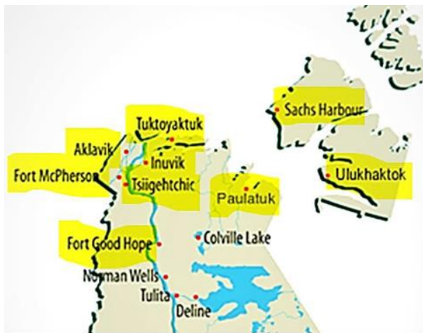
Les communautés arctiques desservies par la Région de l'Ouest de la SSVP sont indiquées en surbrillance