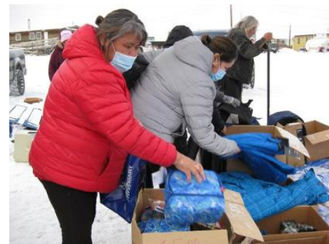
Des résidents d'Aklavik distribuent des produits non alimentaires.

destinés aux personnes âgées de la communauté, mais cette année, en raison de la Covid-19, beaucoup de jeunes familles se trouvent en situation d'insécurité alimentaire et ont également reçu de l'aide dans le cadre du projet Au nord du 60e .