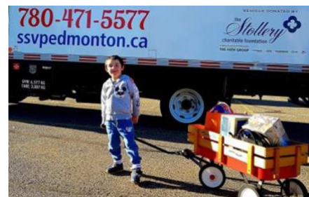
Dons de paroissiens

Nous recevons toujours des dons de paroissiens lorsqu'un camion ou un conteneur maritime se trouve dans le stationnement de l'église. Cependant, la plupart des aliments en vrac et des produits non alimentaires sont recueillis dans un entrepôt et expédiés dans des conteneurs maritimes grâce à l'aide offerte par des entreprises locales. Nous sommes extrêmement heureux qu'autant de gens savent et reconnaissent l'importance de notre travail en vue d'aider les membres vulnérables de notre communauté.