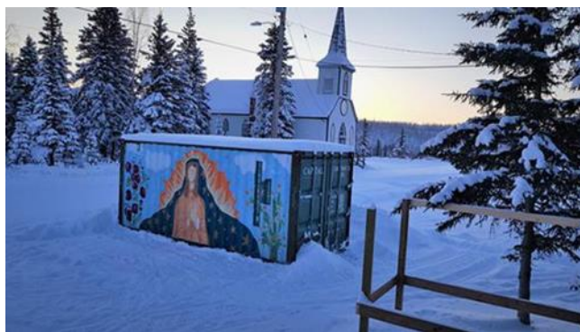
L'église Our Lady of Good Hope et le conteneur maritime servant d'unité permanente d'entreposage

La communauté de Fort Good Hope (Kasho Gotine) a vidé son conteneur maritime. Les matelas d'hôpital donnés ont été entreposés pour les situations d'urgence, comme les inondations; pour ce qui est des deux lits – l'un a été remis à une ancienne personne itinérante qui a maintenant un toit, et l'autre, à une victime des inondations. Une grande partie des denrées alimentaires s'est retrouvée dans le conteneur maritime d'origine. Le reste est allé à la banque alimentaire. Étant donné que l'état d'urgence sanitaire associé à la pandémie a été levé, la banque alimentaire a été fort occupée, tout comme le comptoir de vêtements. Nous nous apprêtons à livrer les courtepentes aux aînés.