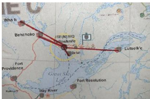
Communautés autour de Yellowknife

Cette année, nous tenons à remercier tout particulièrement Cenovus Energy . Dans le cadre de la modernisation de ses installations de production en Alberta, l'entreprise a fait don à la SSVP de plusieurs centaines de lits afin qu'ils soient remis à des personnes dans le besoin. Un grand nombre d'entre eux ont été acheminés dans nos communautés nordiques, ainsi que dans quelques communautés autochtones de la région de Yellowknife.