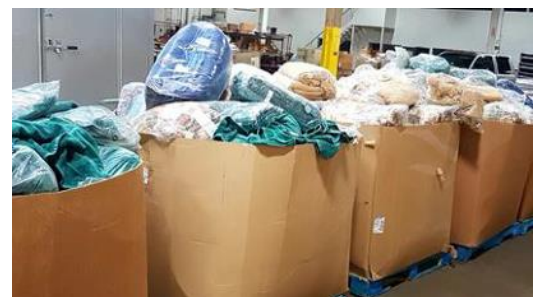
Dons de Right Choice Camps & Catering

Nous avons reçu de nombreuses demandes pour expédier des matelas de sol dans le Nord. Il y a souvent beaucoup de personnes qui vivent sous un même toit dans les communautés arctiques. Une fois de plus, les Services de santé de l'Alberta ont répondu à l'appel en fournissant des matelas légers mais solides, offrant un excellent soutien aux