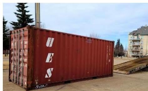
Conteneur maritime dans le stationnement d'une église

Nous recevons toujours des dons de paroissiens lorsqu'un camion ou un conteneur maritime se trouve dans le stationnement de l'église. Cependant, la plupart des aliments en vrac et des produits non alimentaires sont recueillis dans un entrepôt et expédiés dans des conteneurs maritimes grâce à l'aide offerte par des entreprises locales. Nous sommes extrêmement heureux qu'autant de gens savent et reconnaissent l'importance de notre travail en vue d'aider les membres vulnérables de notre communauté.