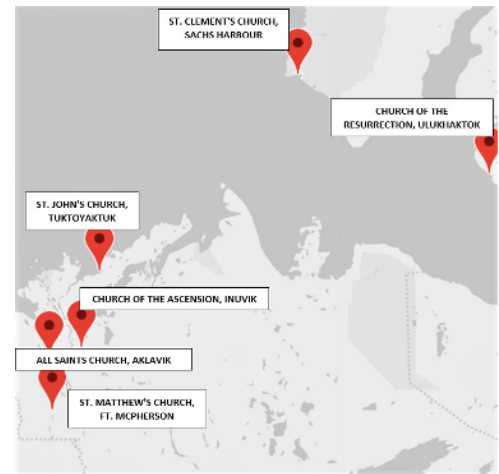
Missions du diocèse anglican de l'Arctique

Ballots pour le Nord est un programme lancé par les femmes de l'Église anglicane du diocèse d'Ottawa. Celles-ci avaient l'habitude d'emballer des courtepointes, des articles ménagers, des vêtements, des vêtements pour bébé, des articles tricotés, etc. Étant donné que plusieurs des communautés nordiques qui reçoivent des conteneurs maritimes dans le cadre du projet Au nord du 60 e sont administrées par le diocèse anglican de l'Arctique, nous avons appuyé ce programme en faisant transiter des marchandises vers les communautés des T.N.-O. Pour une autre année, les restrictions liées à la Covid-19 ont empêché les femmes de fabriquer leurs ballots, mais elles ont envoyé de l'argent qui a permis à Edmonton d'acheter les vêtements dont nous avons besoin pour le Nord canadien.