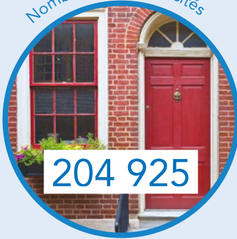
Nombre de foyers visités