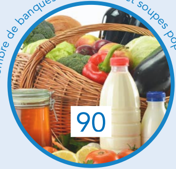
Nombre de banques alimentaires et soupes populaires