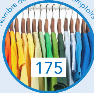
Nombre de magasins et comptoirs