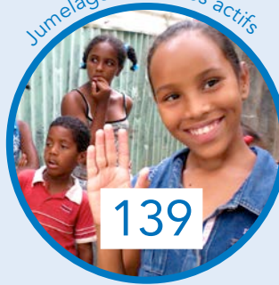
Jumelages externes actifs