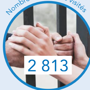
Nombre de détenus visités