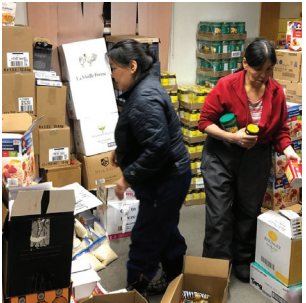
Centre de partage Rankin Inlet, Nunavut

Lors de ma visite à Rankin Inlet au Nunavut, j'ai rencontré les gens de la communauté qui bénéficient du Centre de partage de l'église catholique Mary our Mother, appuyé par la SSVP de la région d'Ottawa. J'ai pu constater que les gens apprécient énormément ce service d'aide alimentaire qui répond directement à leurs besoins personnels. L'approche du dialogue avec la communauté pour bien identifier leurs besoins permet de bien appuyer la communauté.