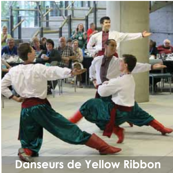
Danseurs de Yellow Ribbon