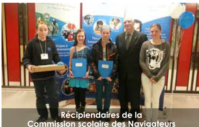
Récipiendaires de la Commission scolaire des Navigateurs

Pour information : Nathalie Couture, responsable des événements 418 522-5741, poste 225