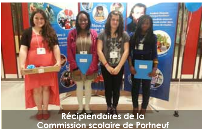
Réceptaires de la Commission scolaire de Portneuf