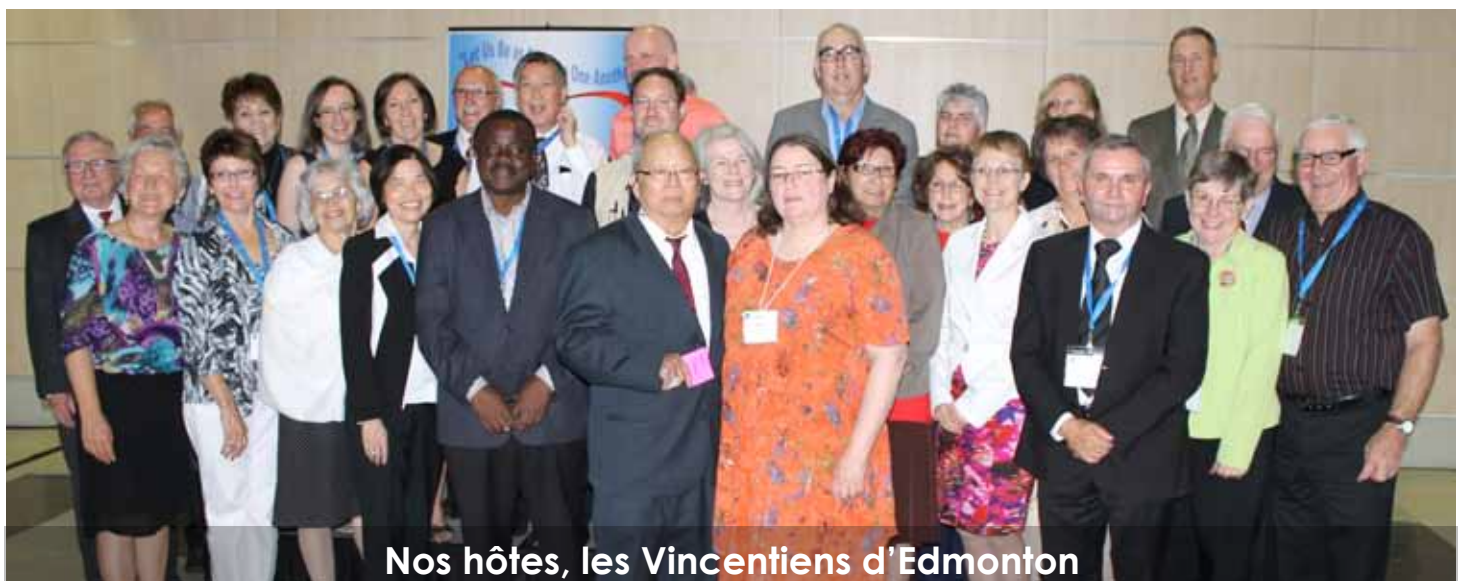
Nos hôtes, les Vincentiens d'Edmonton