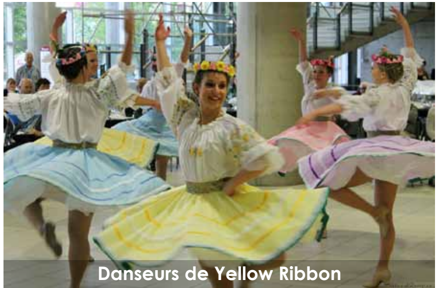
Danseurs de Yellow Ribbon