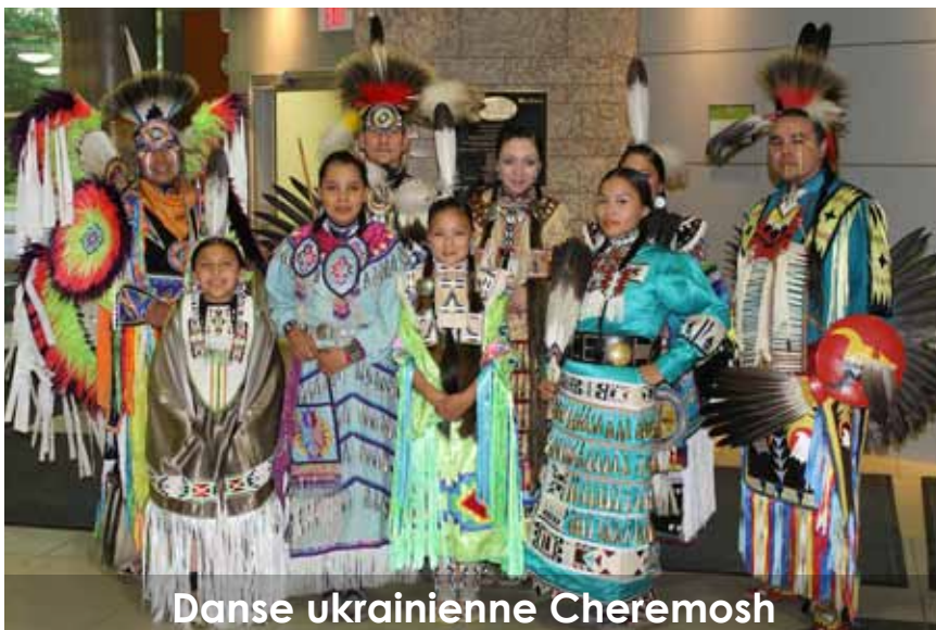
Danse ukrainienne Cheremosh