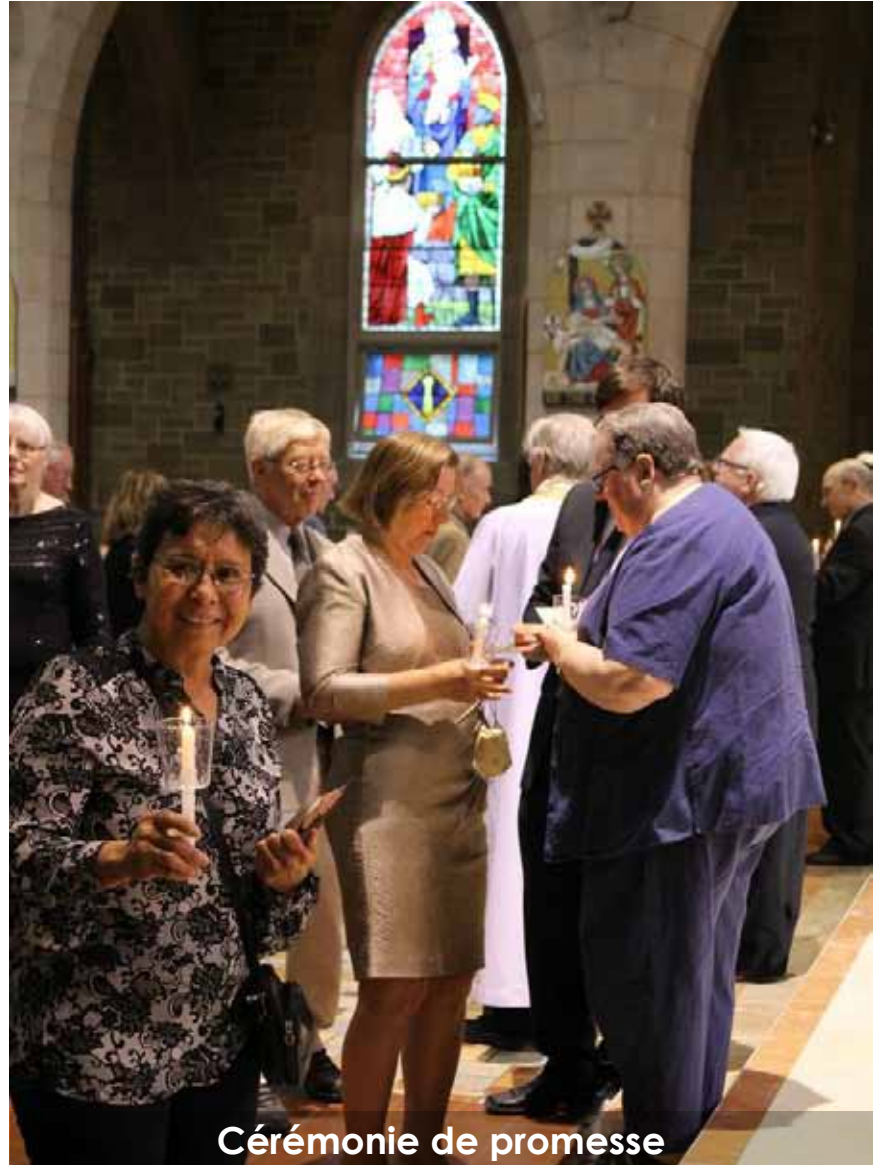
Cérémonie de promesse