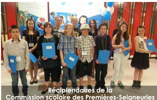
Réceptaires de la Commission scolaire des Premières-Seigneuries