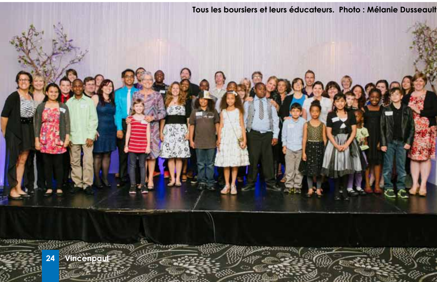
Tous les boursiers et leurs éducateurs.