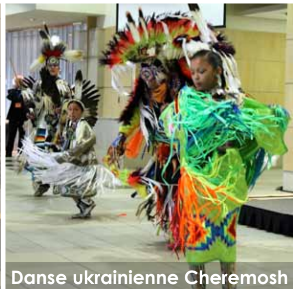
Danse ukrainienne Cheremosh