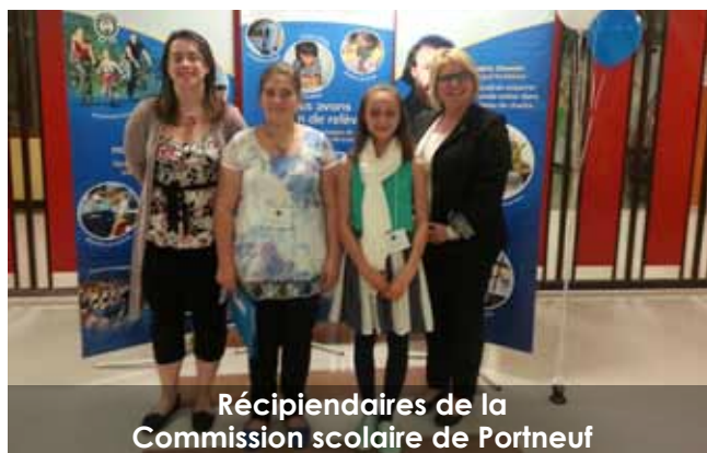
Récipiendaires de la Commission scolaire de Portneuf